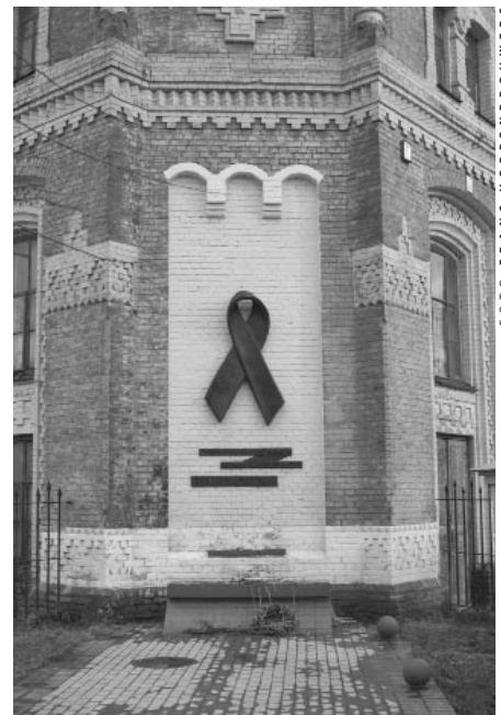
Monument voor aidsslachtoffers bij het Petsjerska Lavra kloostercomplex in Kiev

Zie http://web.worldbank.org en www.unaids.org