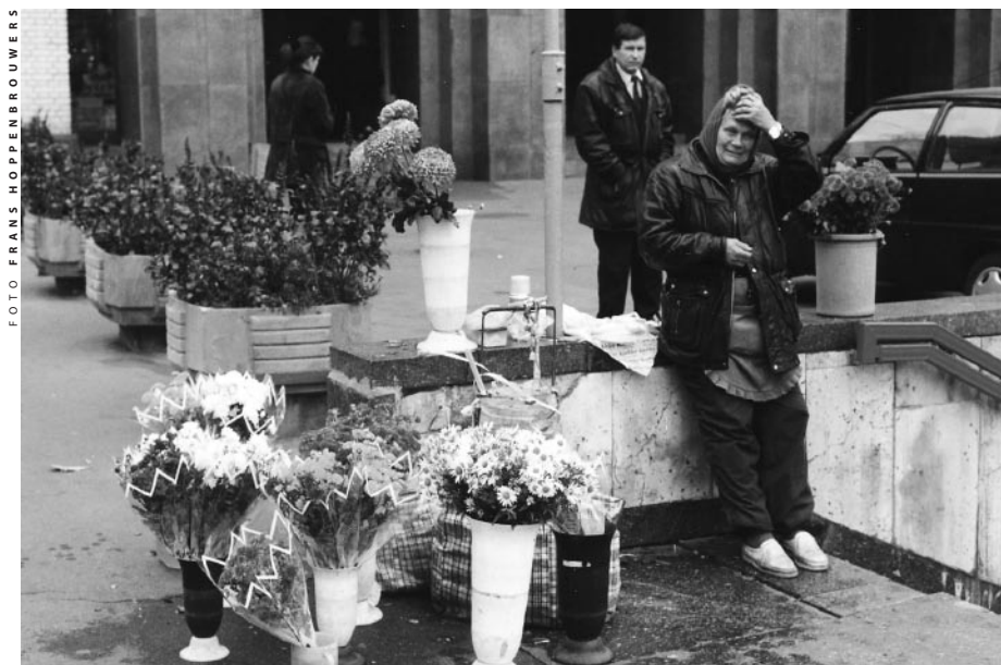
Oudere vrouwen vormen een kwetsbare groep

gehuwden en gescheidenen, mensen met een lage opleiding of met een psychische of psychiatrische stoornis meer gevaar. Wat die laatste groep betreft, treedt een interessant verschil op tussen landen met hoge en lagere inkomens. In het eerste geval hebben stemmingsstoornissen (bijvoorbeeld depressie) de overhand, maar in armere landen als Oekraïne eerder impulsstoornissen (zoals extreme woede-aanvallen en agressie).