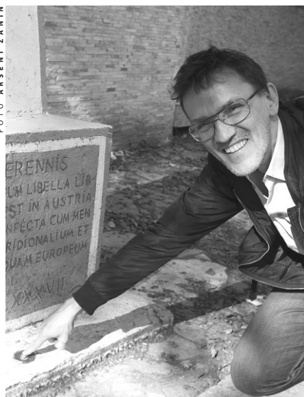
2010: Dilova aan de Roemeens-Oekraïense grens. De studiesecretaris van Communicantes legt zijn vinger op het geografische centrum van Europa

In het kader van de Europe Tour van de Wereldfietsfederatie UCI