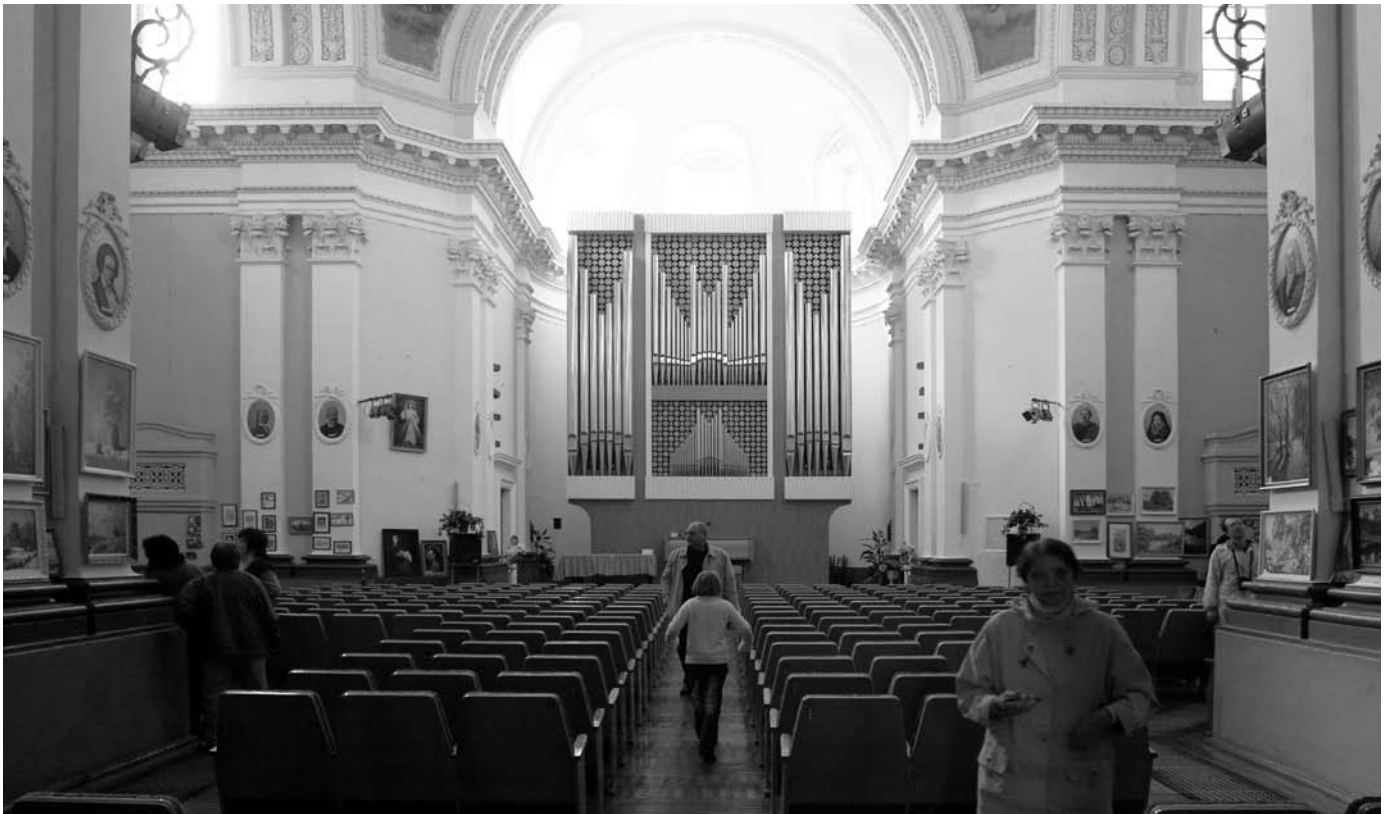
De katholieke kerk van Bila Tserkva, Oekraïne: sinds de jaren '20 een 'huis van de cultuur' met ná 1989 een hoekje voor de zondagse liturgie