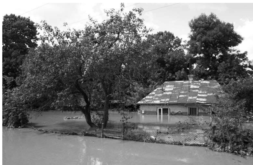
Illegale houtkap en overvloedige regenval veroorzaakte de watersnood van juli-augustus 2008. Een milieuramp was het gevolg. Sterk vervuilde rivieren raakten buiten hun oevers en besmetten leefomgeving en landbouwgrond. Ook een zorg voor de kerk