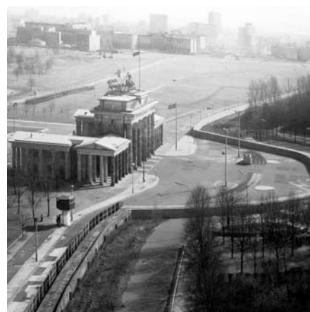
Brandenburger Tor in Berlijn, 1989. Een 'antifascistische beschermmuur' – zo luidde het communistisch jargon – sneed Berlijn en Oost- en West-Europa doormidden

ste schanddaad de moord op circa 8.000 Bosniërs in de enclave Srebrenica. Etnische spanningen rondom de Republiek Servië, bijvoorbeeld in Kosovo, houden onverminderd aan.