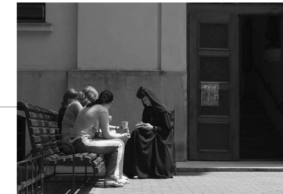
Studenten van de Oekraïense Katholieke Universiteit nemen hun lessen door voor het hoofgebouw.

De antwoorden op de gestelde vraag worden in gesproken en geschreven vorm voorgelegd aan een breed publiek van regiodeskundigen, theologen en kerkelijk betrokkenen, liefhebbers en geïnteresseerden, projectorganisaties en fondsverstrekkers. Inhoud en vorm verschillen van actueel tot achtergrondverkenning, van journalistiek tot wetenschappelijk. De aandacht gaat onder andere uit naar de relatie kerk-samenleving, de binnen- en interkerkelijke ontwikkelingen.