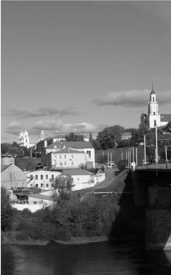
Zicht op Grodno, Wit-Rusland, met de rivier Neman en links de Franciscus Xaverius basiliek